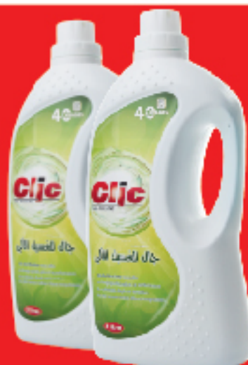
Gel Machine CLIC 1+1 Gratuit 3 L 12 DT .990 Les deux