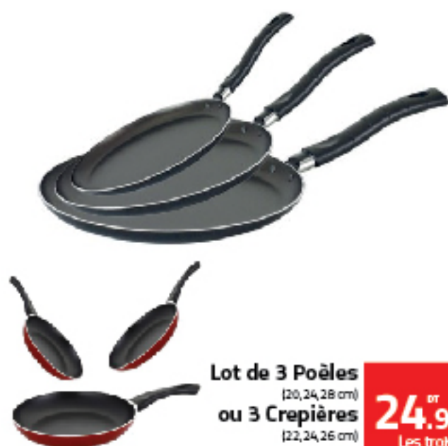
Lot de 3 Poèles (20, 24, 28 cm) ou 3 Crepières (22, 24, 26 cm) METHAP lot de 3