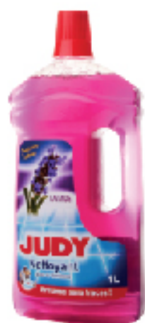
Nettoyant Sols et surfaces JUDY 1 L