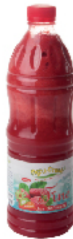
Jus de Fraise frais FINE - AGRUFRESH 1 L