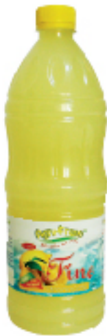
Citronnade Fraiche FINE - AGRUFRESH 1 L