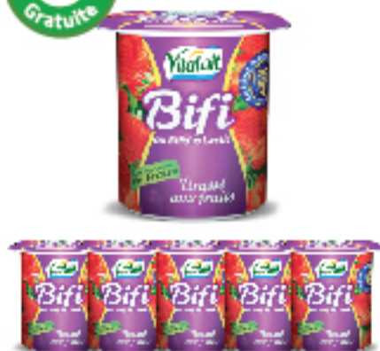
Yaourt Brassé aux fruits VITALAIT 110 g les 6