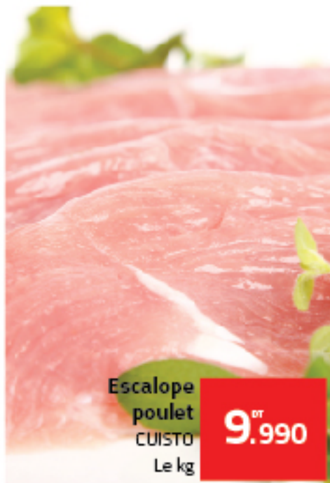
Escalope poulet CUISTO Le kg