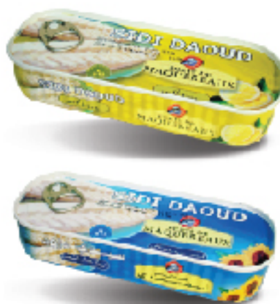
Filet de Maquéreaux Huile de Tournesol, Citron SIDI DAUD 170 g