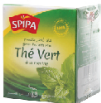
Thé Vert à la menthe SPIPA 10 sachets