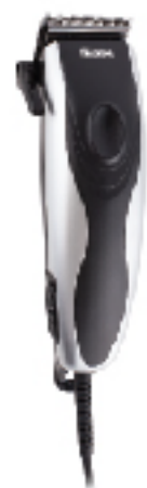
Tendeuse Filaire + 4 peignes TRISTAR