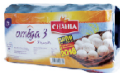
Œufs Frais Oméga 3 CHAHIA 15 pièces