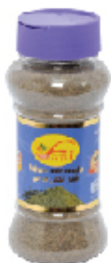
Poivre Noir Moulu FANI 70 g