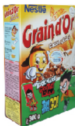
Grain d'Or 300 g