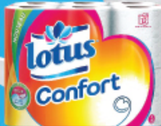
Lotus Confort x12