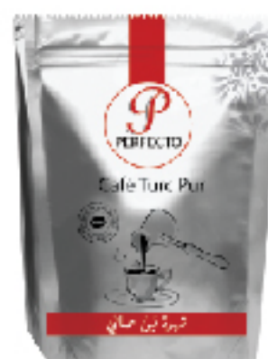
Café Turc Pur PERFECTO 200 g