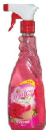
Désodorisant FREETIME 500 ml