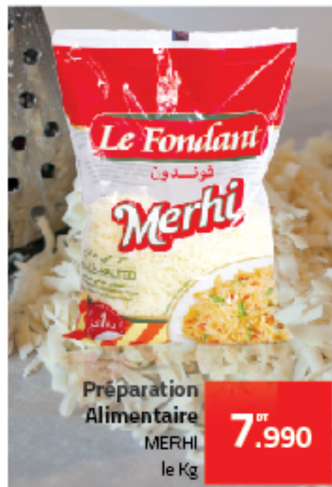
Préparation Alimentaire MERHI le Kg