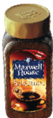
Café Soluble MAXWELL HOUSE 50 g