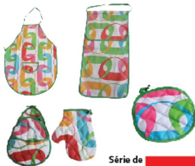
Série de Cuisine Coton SPLENDID 5 pièces