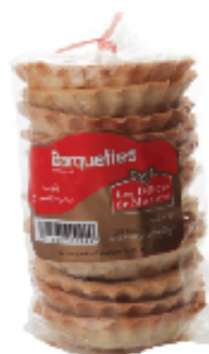
Barquettes Délices LES DÉLICES DE MARIEM 10 pièces