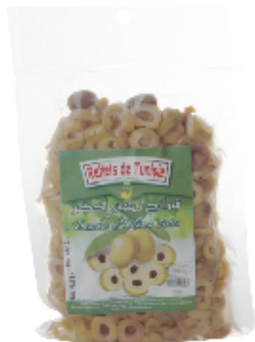
Olives Vertes en Rondelles REFLETS DE TUNISIE 250 g