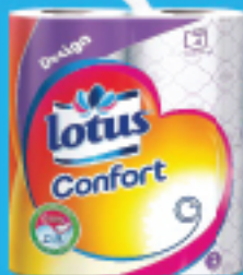
Lotus Confort design x4