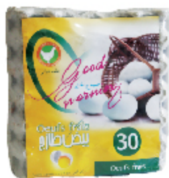
Œufs Frais GOOD MORNING 30 pièces