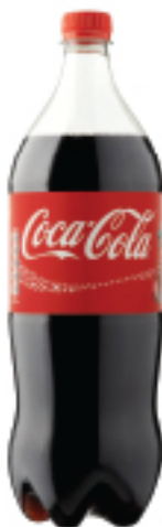
Boisson Gazeuse COCACOLA 1,5 L