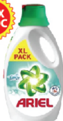
Gel Machine ARIEL 2.34 L