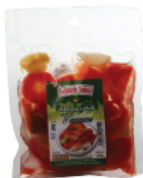
Variantes REFLETS DE TUNISIE 100 g