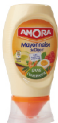
Mayonnaise de Dijon AMORA 235 g