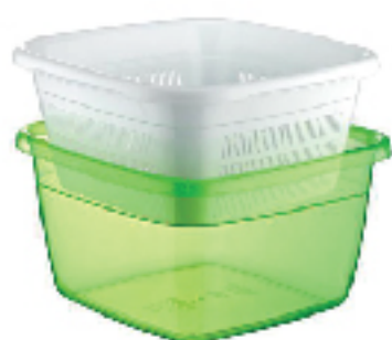
Bassin Emeraude HOBBY LIFE 6 L