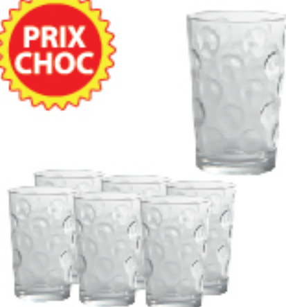
Coffret de 6 Verre à Eau RIO 195 ml Lot de 6