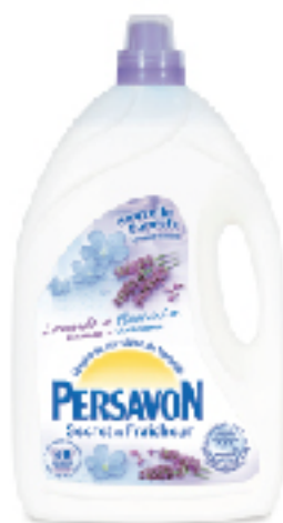
Lessive Machine Secret Fraîcheur PERSAVON 3 L