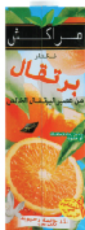
Nectar MARRAKECH 1 L