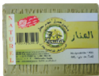
Savon Vert EL MANAR 500 g 1 DT .290