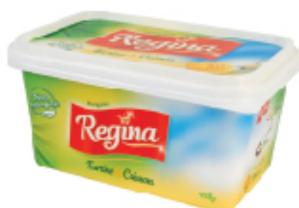
Margarine Tartine & Cuisson REGINA 400 g