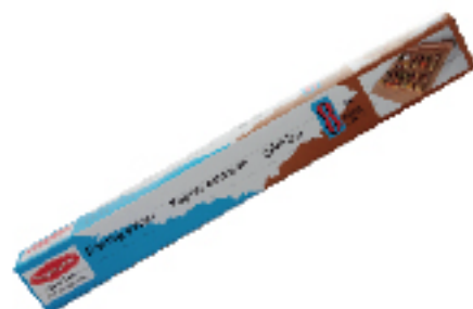
Papier Cuisson TOPPROTECTS 8 m x 38 cm