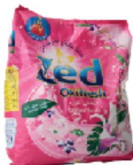
Poudre main ZED 2 kg 3 DT .690