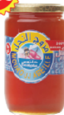
Miel MOUROUJ ABEILLE 1 kg