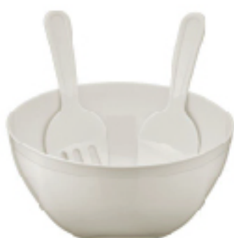
Bol + Cuillère et Fourchette en Plastique HOBBY LIFE 5.5 L