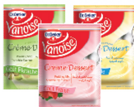
Crème Dessert VANOISE 40 g