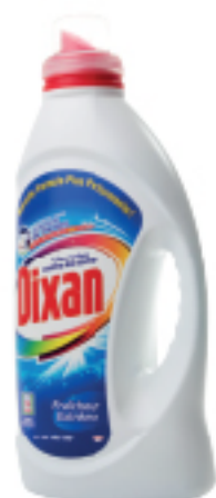
Gel Machine DIXAN 1.65 L 10 DT .990