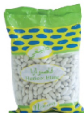
Haricots Blanc NATUREL 400 g