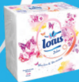
Serviettes de table 2 plis Blanc & imprimée 40*40