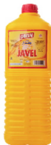
Javel chicom 3 L 1 DT .990