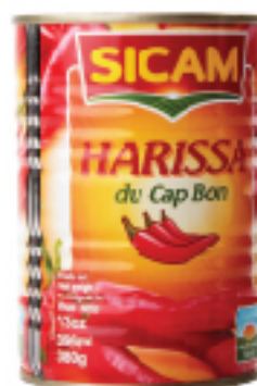
Harissa SICAM 380 g