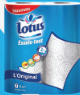
Essuie-Tout l'original Blanc & Design X2