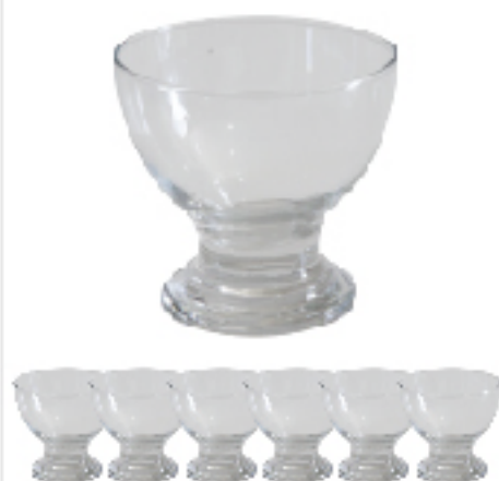
Coffret de 6 Coupe à Glace INSPIRE 235 ml Lot de 6