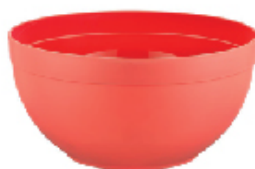
Bol rond en Plastique HOBBY LIFE 8 L