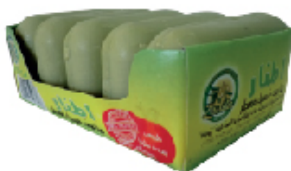
Savon linge EL MANAR Barquette de 4 x 125 g 1 DT .690