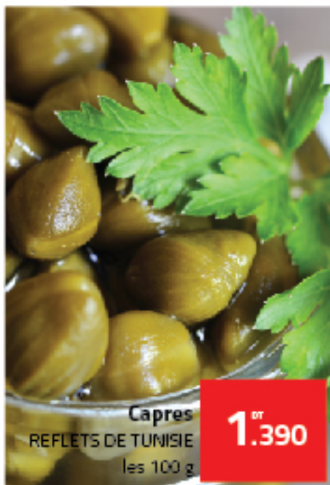
Capres REFLETS DE TUNISIE les 100 g