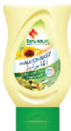
Mayonnaise Squeeze LESIEUR 220 g