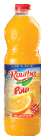
Jus ROUIBA 2 L