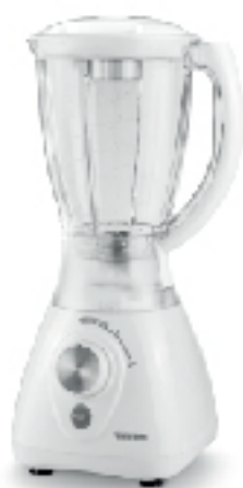
Blender 430 w 2 vitesses TRISTAR 1.5 L