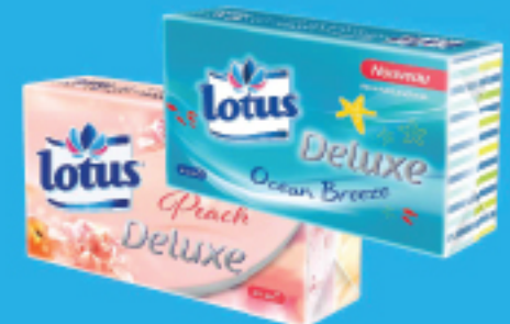
Mouchoirs de poche parfumés