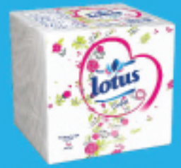
Serviettes de Table 1 pli Blanc & Imprimée 23*23