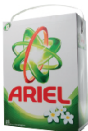
Poudre Machine ARIEL 5 Kg 15 DT .890