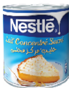
Lait Concentré NESTLÉ 395 g