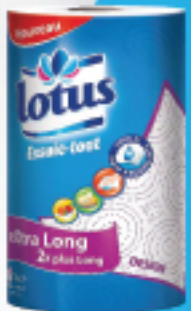
Essuie-Tout Extra Long Blanc & Design X1