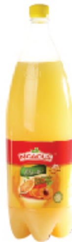
Eau Fruitée N'GAOUS 2 L