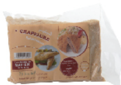
Chapelure LES DÉLICES DE MARIEM 100 g