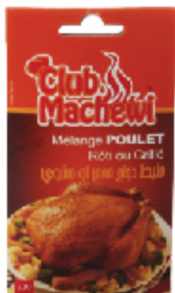
Mélange LES DÉLICES DE MARIEM 20 g