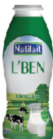
L'ben NATILAIT 450 g