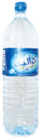
Eau Minérale AQUALINE 2 L