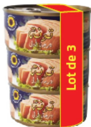
Thon à l'Huile de Tournesol LORD FOOD 3 x 160 g