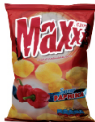
Chips MAXXX 75 g