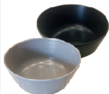
Bol Céramique MULTICOULEUR Ø 14 cm