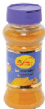
Curcum Moulu FANI 70 g