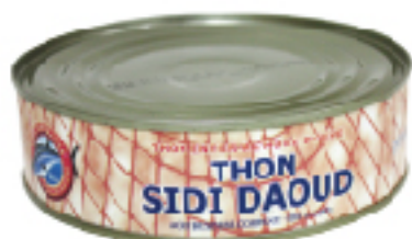
Thon à l'Huile d'Olive SIDI DAUD 620 g