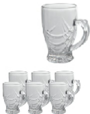
Coffret de 6 Verre à Thé ALAMANY 110 ml Lot de 6