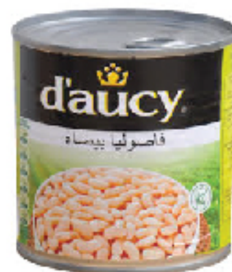
Haricot Blanc D'AUCY 400 g