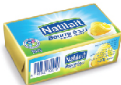
Beurre Extra Fin NATILAIT 200 g