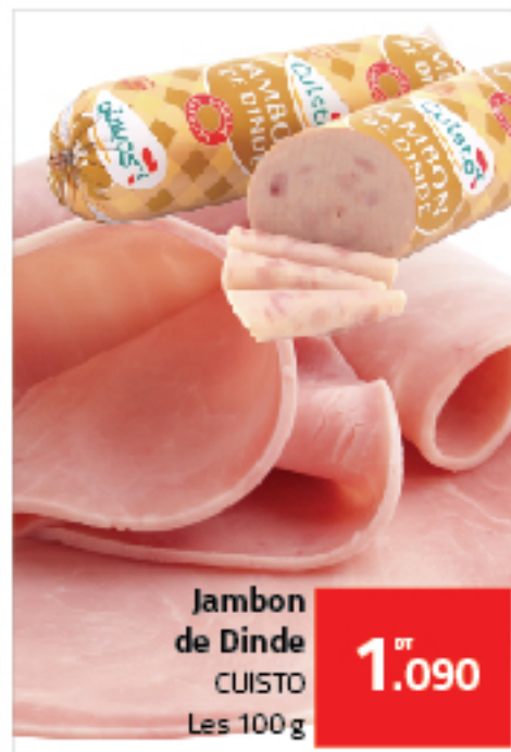
Jambon de Dinde CUISTO Les 100 g