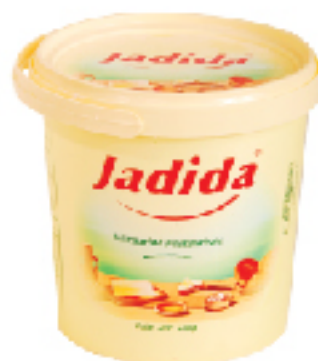
Margarine Pasteurisée JADIDA 500 g