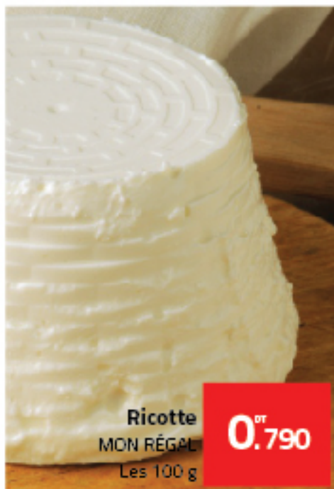
Ricotte MON RÉGAL Les 100 g