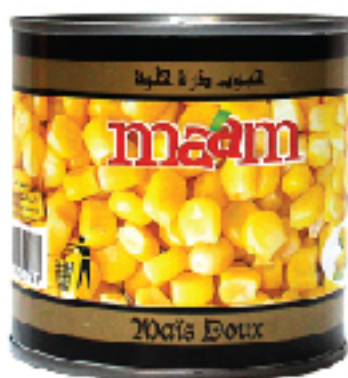
Mais Doux MAAM 340 g