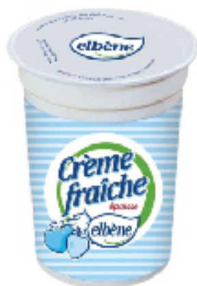
Crème fraîche ELBENE 15 cl