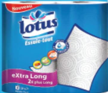
Essuie-Tout Extra Long Blanc & Design X2