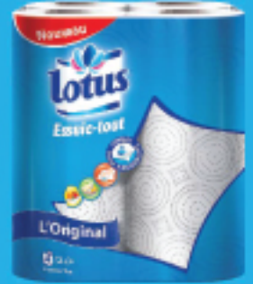
Essuie-Tout l'original Blanc & Design X4