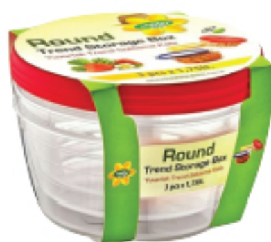
Boîtes Ronde HOBBY LIFE 3 x 1.75 L