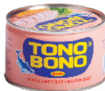
Thon à l'Huile d'Olive TONO BONO 400 g