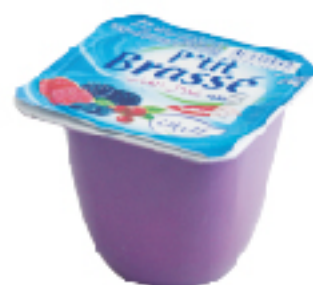
Yaourt Brassé ELBENE 80 g