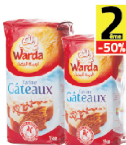
Farine Gâteaux WARDA 1 kg -50% sur la 2ème