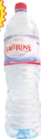
Eau Minérale SABRINE 1,5 L