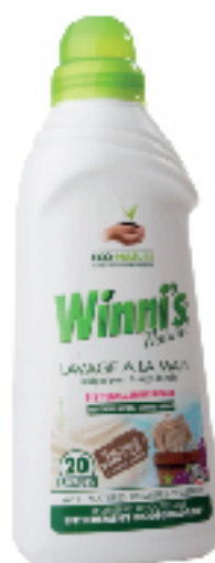
Savon liquide main WINIS 750 ml 4 DT .290