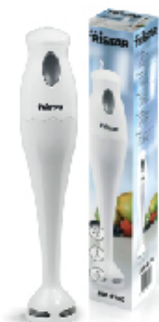
Mixeur Plongeur 1700 w TRISTAR