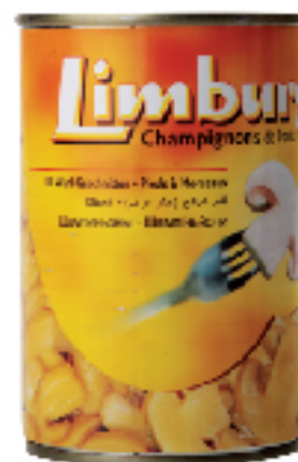
Champignons LIMBURG 290 g