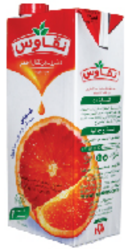
Boisson au Jus N'GAOUS 1 L