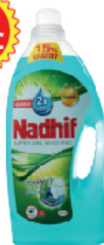
Gel Machine NADHIF 3 L 12 DT .490