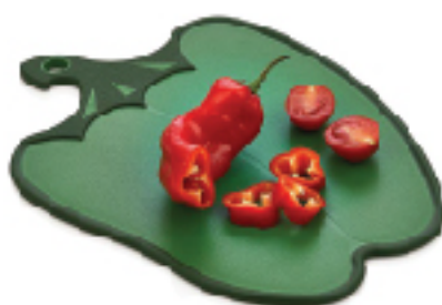
Planche à découper HOBBY LIFE