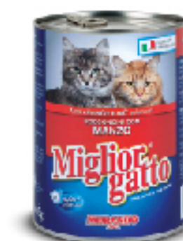
Aliment pour Chat MIGLIO GATTO 405 g